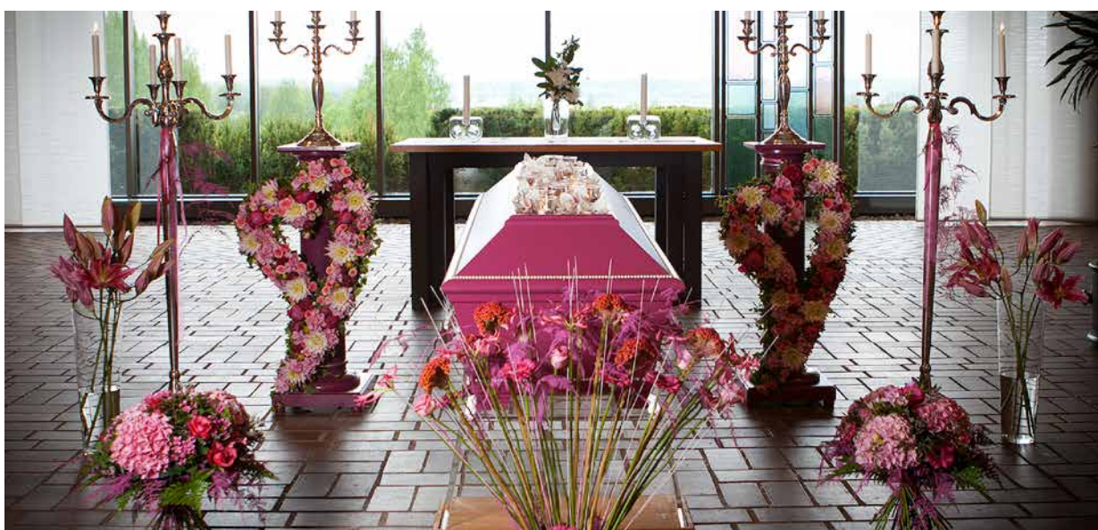
Favoritfärgen i blommor och utsmyckning gör ceremonin personlig.