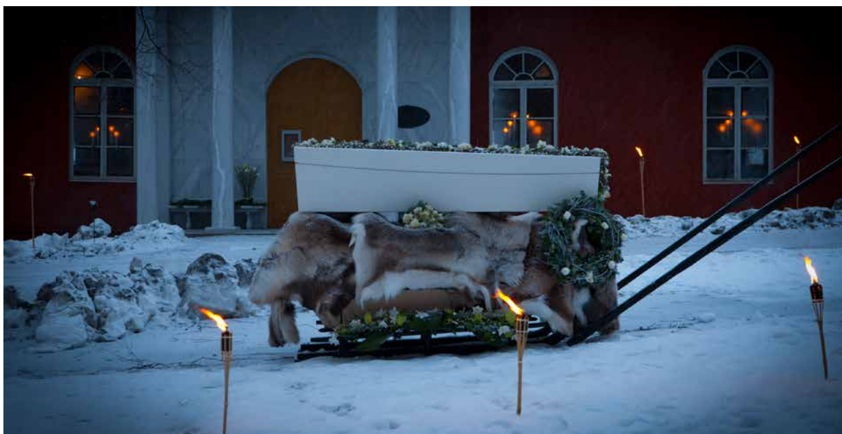
Låt årstiden vara en del av upplevelsen.